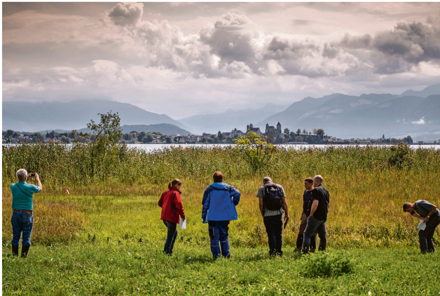
Für die Jurymitglieder ist die Wiese bei Feldbach eine der schönsten.

Im Normalfall ist eine Wiese ein Produktionsfaktor für den Bauernbetrieb. Fünf- bis sechsmal im Jahr erntet der Landwirt das Gras, um es seinem Vieh zu verfüttern. Um dies zu ermöglichen, brauchen die Pflanzen viel